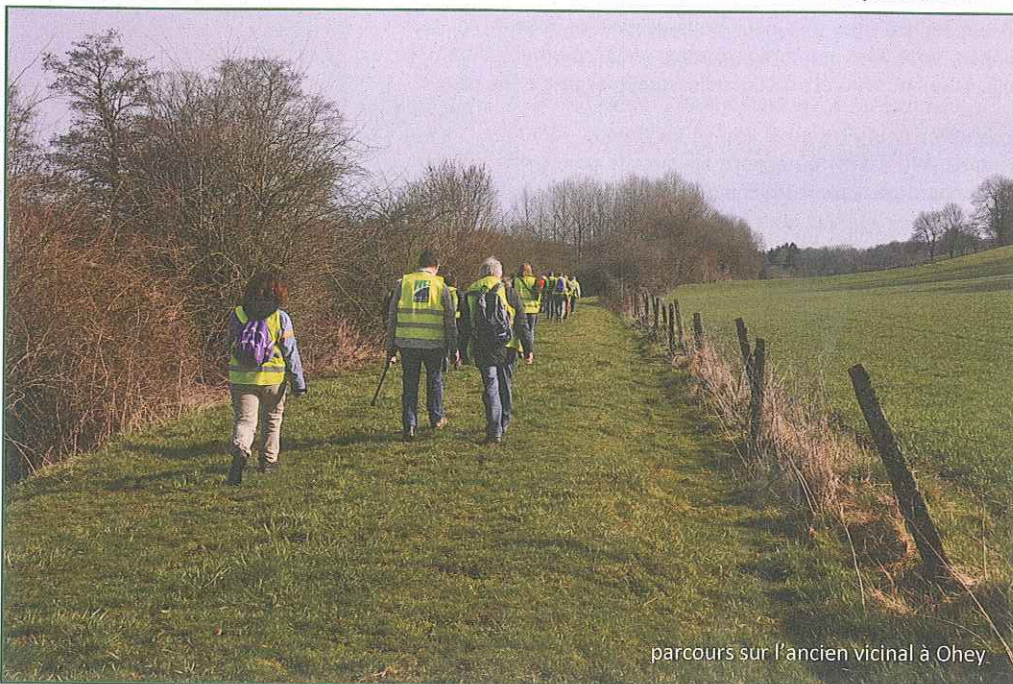
parcours sur l'ancien vicinal à Ohey