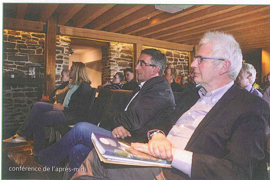
conférence de l'après-midi

Toutes et tous, de leur position respective, leur fonction statutaire et leurs compétences spécifiques contribueront incontestablement par leur expertise à assumer les responsabilités qui leur incombent.